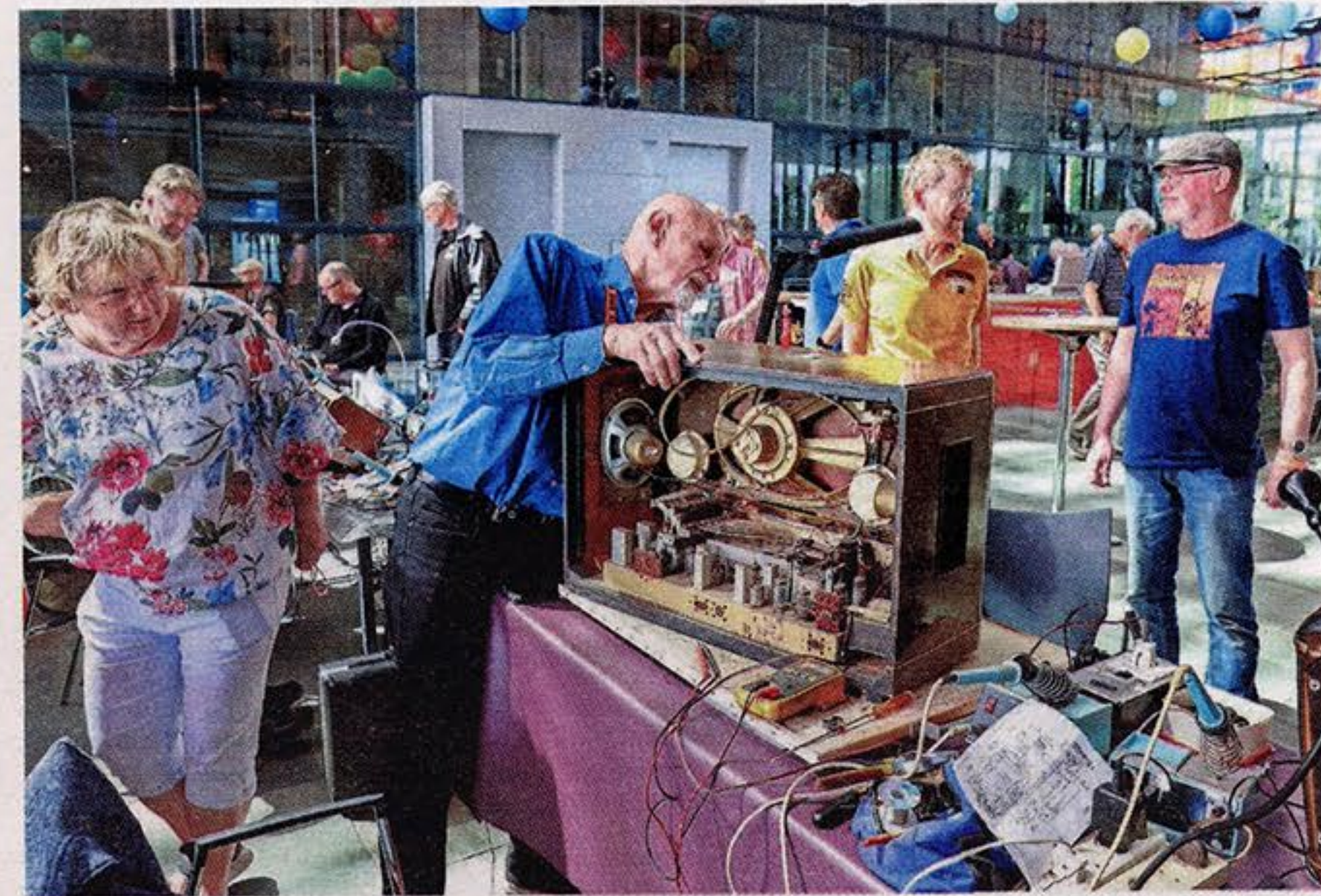
Eerst open schroeven en dan eens kijken wat er mis is.

“Zo'n dertig jaar geleden zag ik in Frankrijk een oude radio staan en heb ik het virus voor dit spul opgelopen